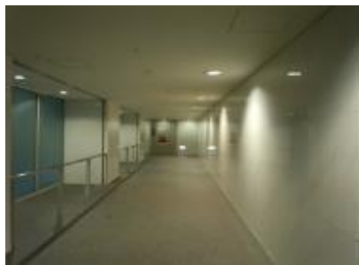
⑦地下2階エレベーター付近通路壁