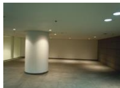
⑤地下1階南側階段上部踊場