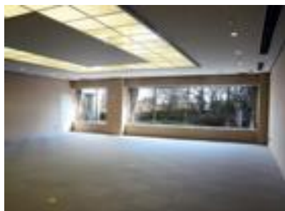
②12階アートスペースH