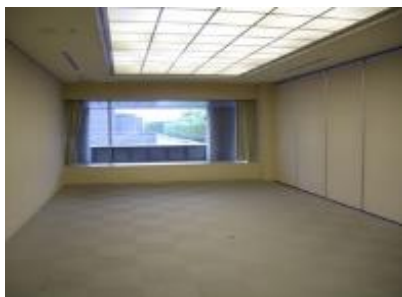
①12階アートスペースG