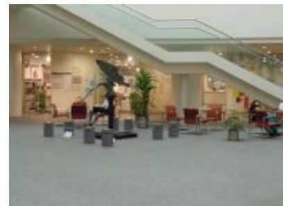
⑧地下2階フォーラム