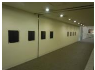
⑥地下2階通路展示ケース